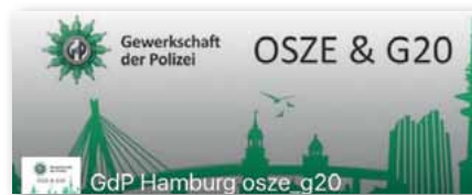
Auf Facebook: GdP Seite OSZE und G 20

Der G20-Gipfel in Elmau, G7 in Lübeck und nun OSZE und G 20 mitten in Hamburg. Bereits seit Monaten bereitet sich die Hamburger Polizei intensiv auf beide herausragenden Einsatzanlässe vor.