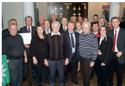
Bereits seit 40 Jahren in der Gewerkschaft

Leider konnten auch in diesem Jahr nicht alle eingeladenen Kolleginnen und Kollegen den Einladungstermin wahrnehmen, da sie sich zu diesem Zeitpunkt entweder im wohlverdienten Urlaub befanden, oder aus anderen Gründen absagen mussten.