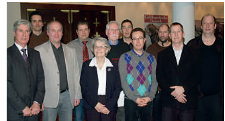
Unsere Youngster: 25 Jahre GdP

Der Landesbezirksvorstand dankt allen Mitgliedern für ihre Treue zur GdP. Wir freuen uns auf die nächste Veranstal-