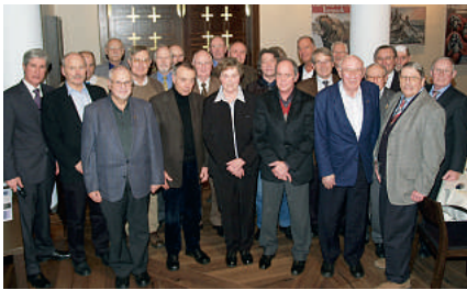
Herzlichen Glückwunsch: 50 Jahre Mitglied!