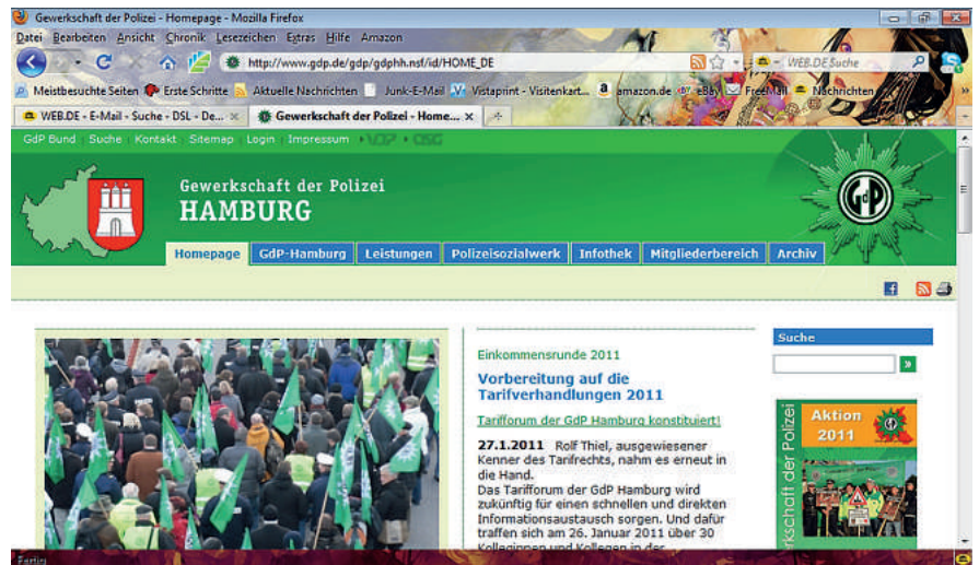
Aktuell und modern: unser GdP-Internet-Relaunch!

Doch damit ist jetzt in Hamburg Schluß! Nachdem Ende November die notwendigen Mittel im Landesvorstand bewilligt wurden, konnte in schneller und problemloser Absprache und mit sehr viel engagierter Unterstützung durch Frau Schmidt von der OSG in Hilden das Ziel des Relaunch der Hamburger GdP-Internetseite realisiert werden. Zunächst