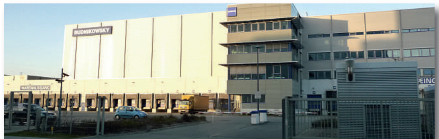
Das Hochregallager in Allermöhe

Wir treffen uns um 14.50 Uhr im Hermann-Wüsthof-Ring 20, 21035 Hamburg-Allermöhe.