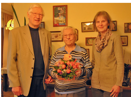
Herzliche Glückwünsche der GdP Hamburg