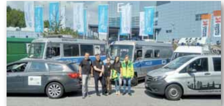
Die Einsatzbetreuung – GdP vor Ort!

Möglichkeit des Tagesdienstes ab einem Alter von 45 Jahren in allen Sparten für alle Schichtdienstleistenden, Durchlässigkeit zwischen den Sparten muss eine Selbstverständlichkeit werden.